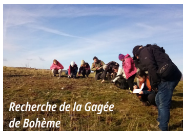
Recherche de la Gagée de Bohême