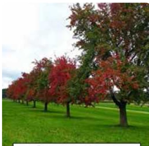
Exemple de rougissement d'arbres atteints de Pear decline

Pas de prélèvement suspect, mais une suspicion de dépérissement du "Phytoplasme du dépérissement du poirier" ( Candidatus phytoplasma pyri ), dit également "Phytoplasme du Pear decline",