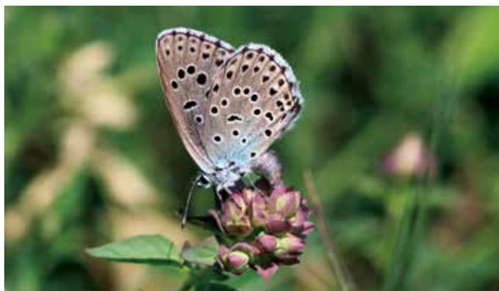
L'Azuré du serpolet est une espèce parapluie (espèce dont le milieu de vie permet la protection d'un grand nombre d'autres espèces si celle-ci est protégée), papillon rare et protégé au niveau national présent sur les Puys de Bane et d'Anzelle