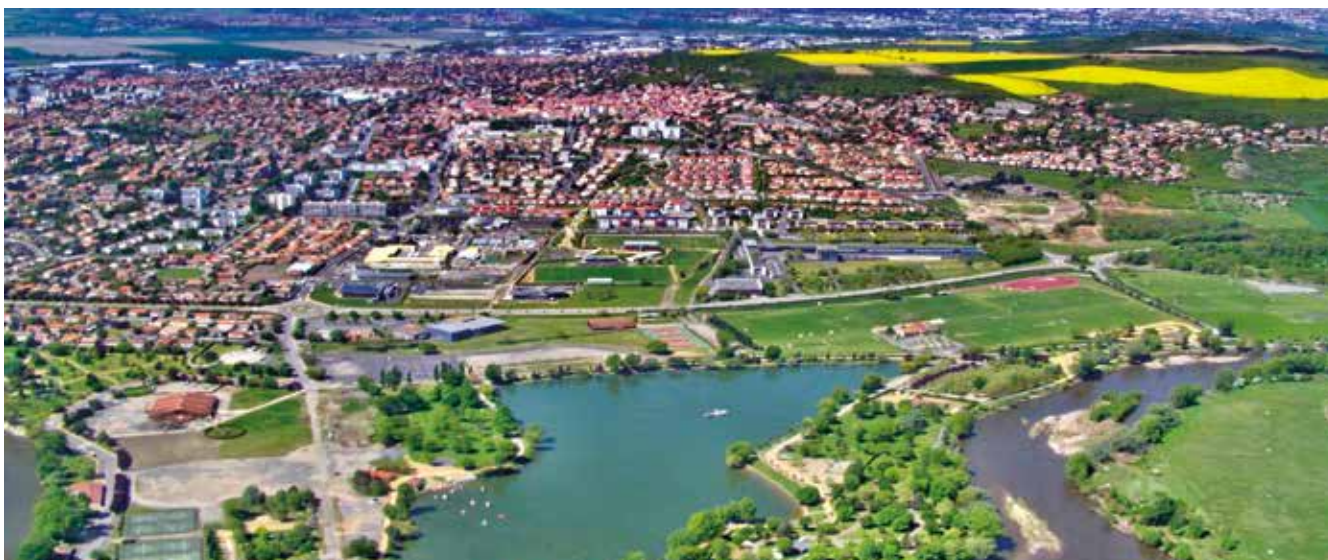
Cournon-d'Auvergne de l'Est (premier plan - val d'Allier-zone de captage AEP) vers l'Ouest (plateau cultivé et puits).