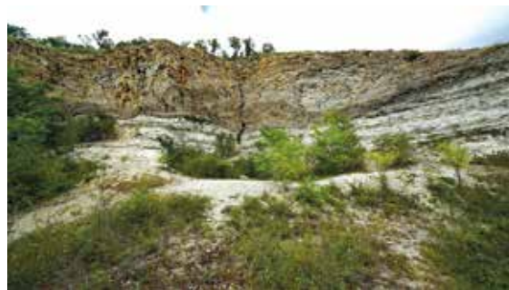
Les fronts de taille de l'ancienne carrière au flanc du Puy de Bane permettent de lire une partie de l'histoire géologique du secteur.