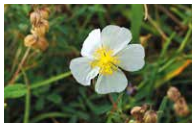
L'Hélianthe des Apennins est une des plantes thermophiles (qui aiment la chaleur) présentes sur les Puys de Bane et d'Anzelle.