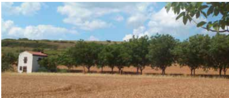
Cournon-d'Auvergne est connue pour ces alignements de noyers au sein des grandes cultures, jouant ainsi un rôle paysager et amenant de la diversité.