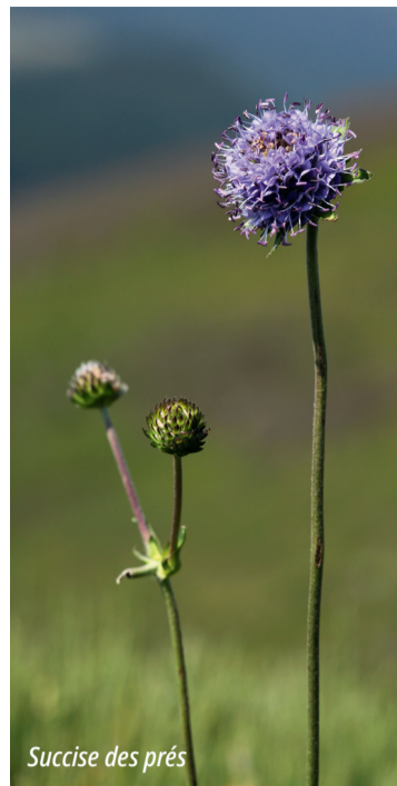
Succise des prés

Attention, ce papillon peut facilement être confondu avec d'autres espèces pour les non-initiés !