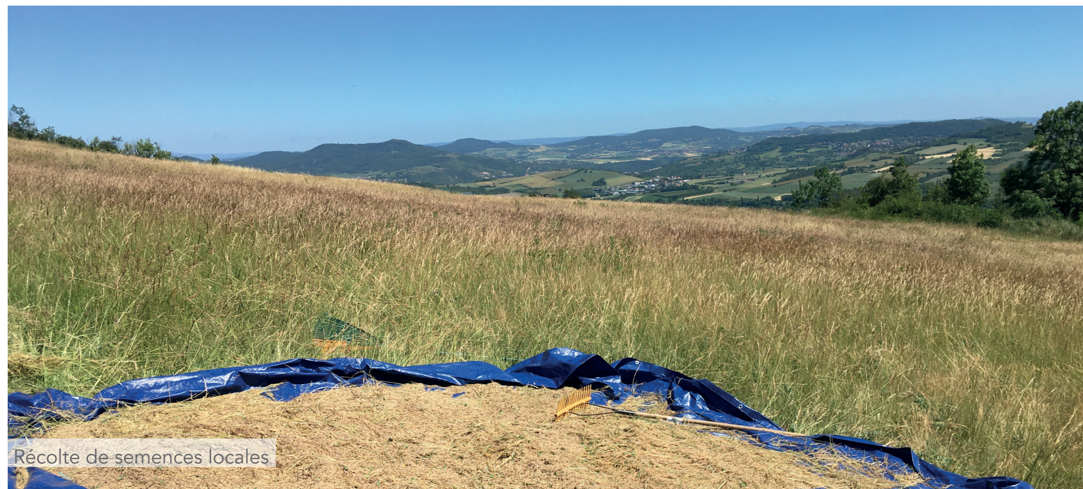
Récolte de semences locales

Les prairies naturelles représentent de véritables atouts pour les fermes et les territoires !