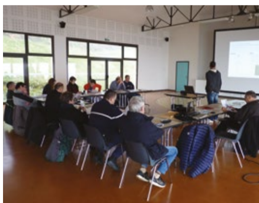
Réunion de concertation