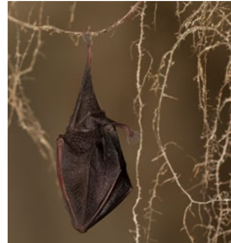
Petit rhinolophe - T. Bernard

Chauve-Souris Auvergne a réalisé, durant les étés 2018 et 2019, un inventaire des chiroptères fréquentant le site Natura 2000.