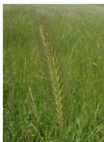
Orge faux seigle