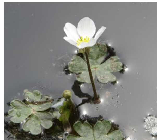
Renoncule tout blanche

Dans le cadre du suivi des mesures compensatoires, le Rubanier nain ( Sparganium minimum ) et une deuxième station de Boulettes d'eau ( Pilularia globulifera ) ont été trouvés sur le site Natura 2000.