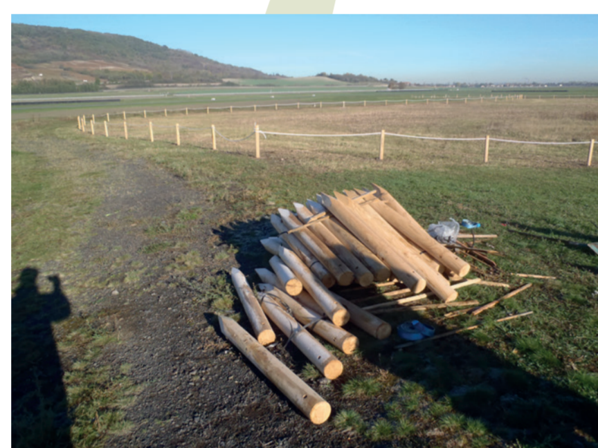
Délimiter la zone protégée permet de bien l'identifier, en particulier lors d'actions exceptionnelles.