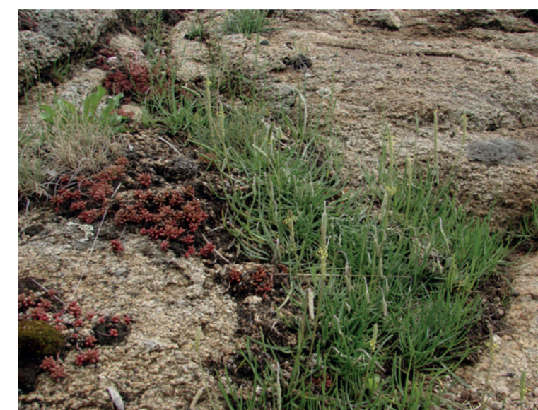
L'étude génétique sur les Plantains a montré une grande distance génétique entre les populations côtières et auvergnates, renforçant l'intérêt de leur préservation.