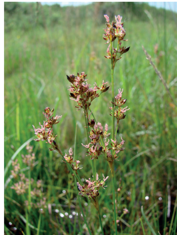
Jonc de Gérard