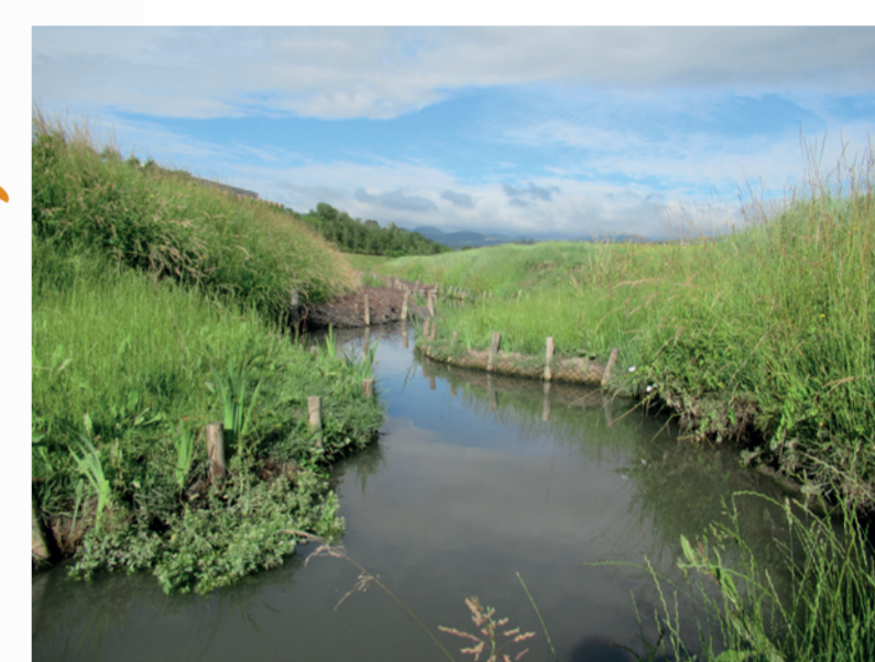
Des travaux de restauration du Rif ont été réalisés, le lit mineur a été réduit et la végétation restaurée.