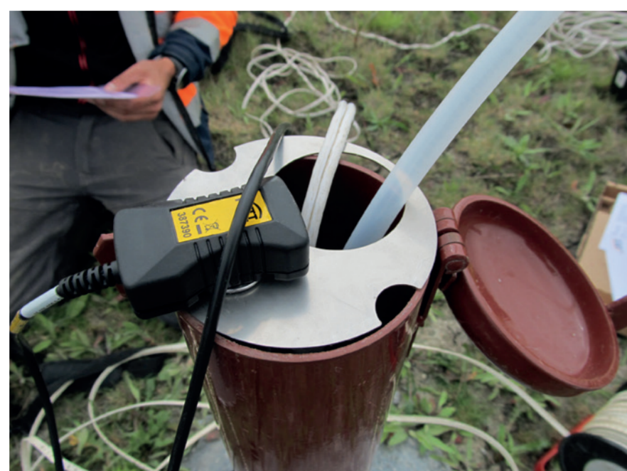
Les sondes sont installées dans le piézomètre sur le pré salé et dans le puits de captage F15. Elles permettent de mieux comprendre le fonctionnement hydrologique de la nappe.

450 ha de superficie 43 km de pistes d'essais 79 bâtiments 3 500 salariés