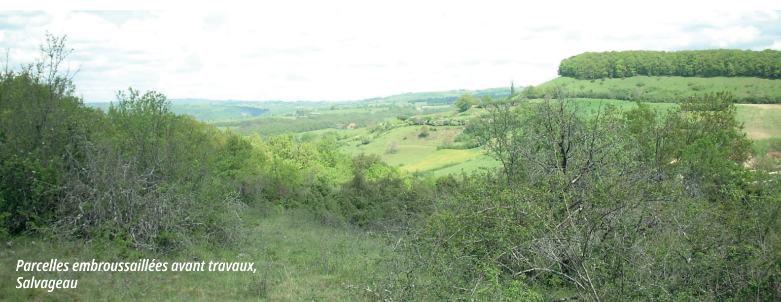
Parcelles embroussaillées avant travaux, Salvageau