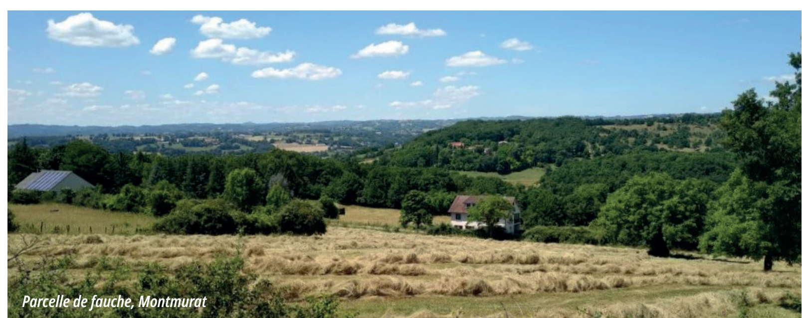
Parcelle de fauche, Montmurat

Fin 2023, un comité de sélection régional s'est réuni et a retenu ce projet de PAEC « Milieux thermophiles du Sud-Cantal » . Le CEN Auvergne lancera donc les démarches en 2024 auprès des agriculteurs afin de leur proposer la mise en place de MAEC sur leurs parcelles pour la période 2024-2028.