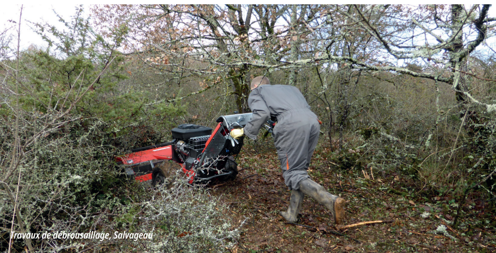
Travaux de débroussaillage, Salvageau

Depuis, un partenariat avec quatre éleveurs locaux a été signé pour une gestion pastorale durable qui met en valeur ce site remarquable et sa richesse floristique !